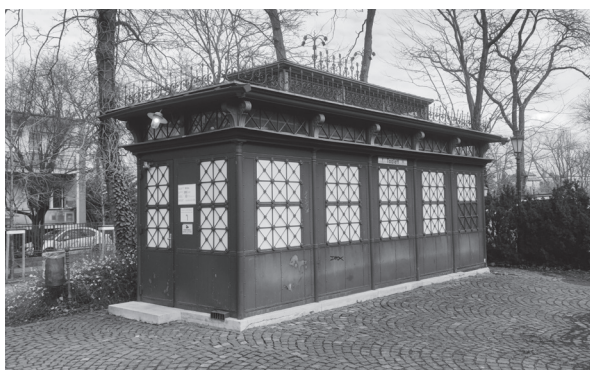
Beetz-féle zöld ház (Budapest, I. kerület, Lovas út)