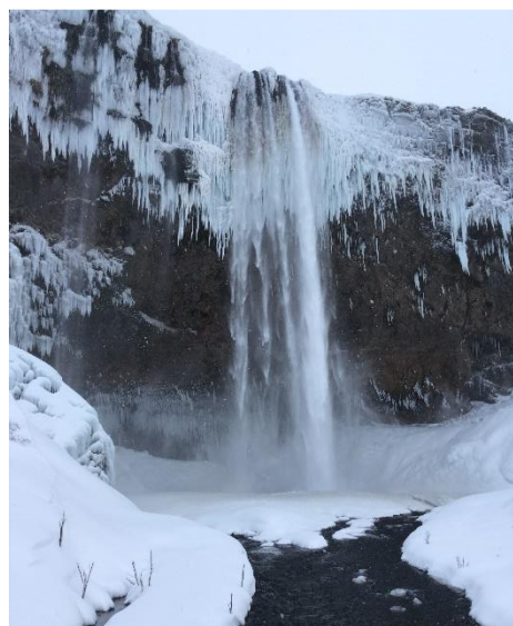
2. kép: Seljalandfoss

Kintlétem alatt egy Bed & Breakfast-nek segítettem marketingspecifikus területen, mint például a szobák árazása, aktív részvétel a cég új weboldalának elkészítésében, kép- és videoszerkesztés, közösségi oldalak frissítése, e-mail marketing.