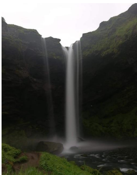
1. kép: Kvemufoss

Az Erasmus+ Szakmai gyakorlat keretében 6 hónap gyakornoki pozíciót töltöttem be a világ egyik legszebb országában, Izlandon 2017 november és 2018 május között.