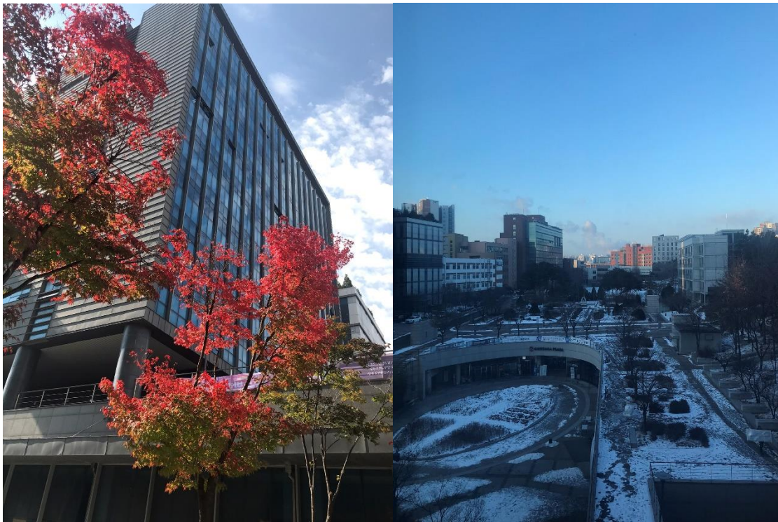
A campus ősszel és télen

A végső dolog, amit szeretnék kiemelni az egyetemmel kapcsolatban: egyszerűen jó volt odajárni. Az épületek modernnek és jól felszereltek, a campus tele van növényekkel, különböző eseményeken vehetünk részt (például az egyhetes őszi fesztiválon), szabadidős klubok tagjai lehetünk. Az egyetem egyik diákszervezete, a HUG kifejezetten azzal foglalkozik, hogy részképzésüket töltő nemzetközi diákoknak szervezzen programokat. Így igazán könnyű volt megismerni másokat és Koreát: eljuthattunk például palotákba, a demilitarizált zónába, buddhista templomokba vagy éppen koreai spaba. Aktív közösségi élete lesz tehát annak, aki a Sogangot választja.